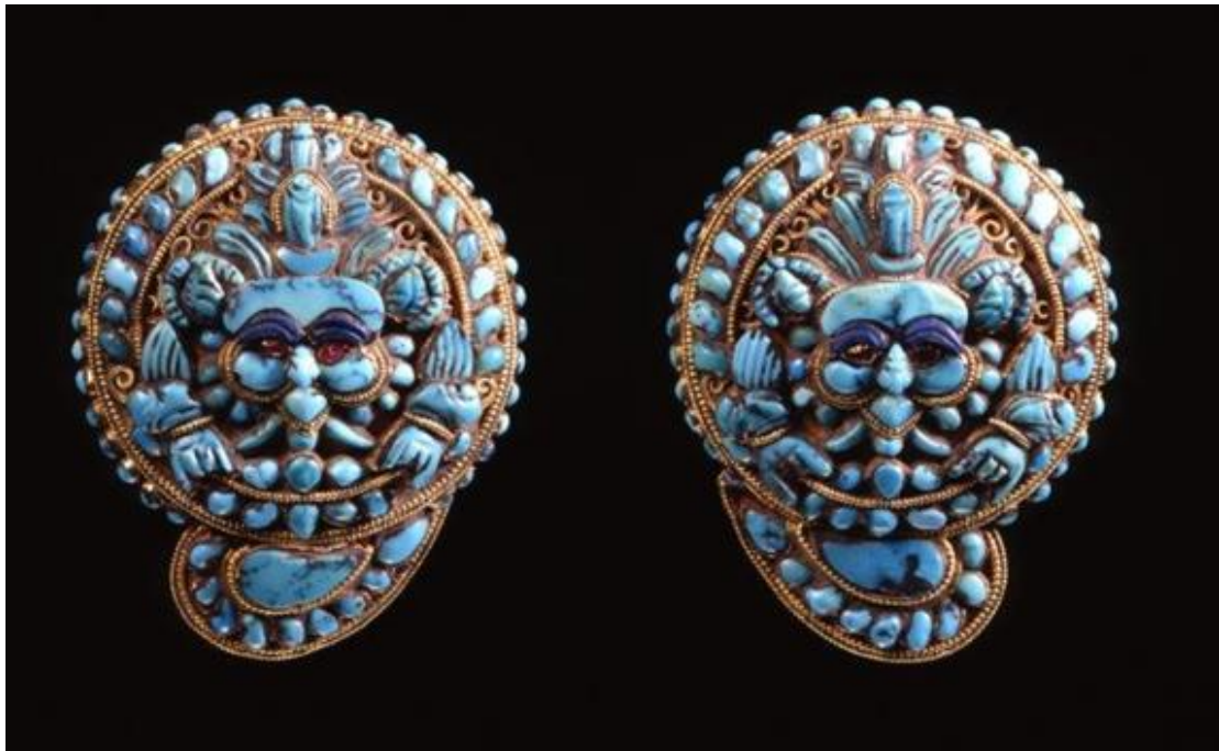
Eléments de parure de statue ? Tibet. XIX e siècle. Or, turquoise, pâte de verre, lapis-lazuli, rubis et spinelle. H. 6cm. Inv. 2506-34 A et B. Musée Barbier-Mueller.

De plus, le mercredi 22 novembre, de 12h15 à 12h45, il introduira les participants aux « chamanismes népalais ». Il assurera également une visite guidée l'exposition Trésors cachés de l'Asie du Sud-Himalaya , de 13h30 à 14h le même jour.