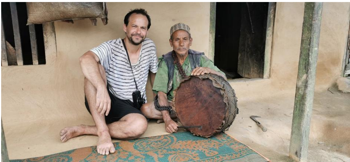
Archives Adrien Viel

L'anthropologue Adrien Viel se consacre depuis plusieurs années à observer le monde des Chepang, une communauté unique au Népal. Son livre est le fruit de recherches approfondies, allant au-delà des frontières académiques pour capturer l'essence même de la vie des Chepang. Il a documenté leur histoire, leurs rituels chamaniques, leurs coutumes liées au cycle de la vie, à la chasse et à la production de ressources. Son analyse détaillée trace leur parcours de la vie nomade à la vie sédentaire, tout en les situant dans le contexte de l'histoire népalaise sur deux siècles.